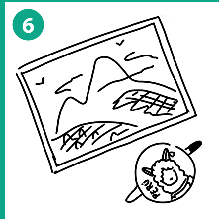
6 Postales y pines son añadidos al paquete