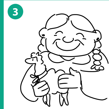
3 Vista frontal persona autoctona preparando el paquete del consumidor con souvenirs y demás accesorios típicos de la región