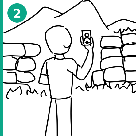
2 Vista tercera persona del individuo autóctono de la región, que, habiendo sido contactado, prepara el video introductorio para el consumidor