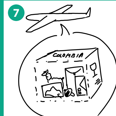
7 Pequeña parte explicativa donde se muestra el paquete siendo enviado por avión hacia el país del consumidor solicitante