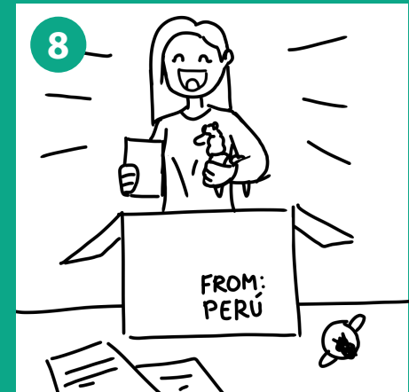
8 Vista tercera persona de consumidor abriendo paquete y disfrutando de la nueva experiencia de turismo desde casa