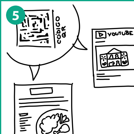
5 Pequeña parte explicativa donde se muestran los accesos a videos y fotos linkeados en youtube y otros canales de comunicación para el consumidor